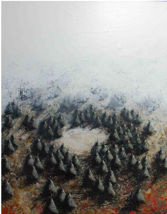
Akelarre – Technique mixte